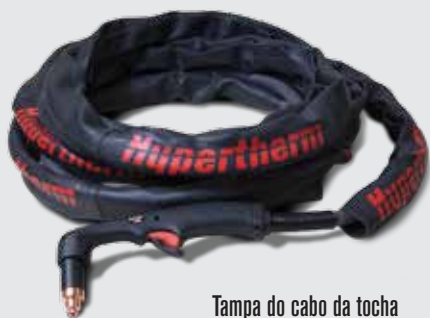
Tampa do cabo da tocha