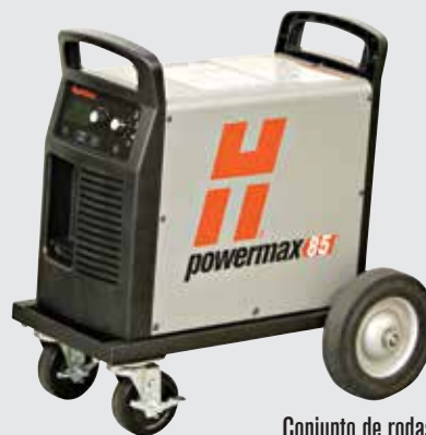
Conjunto de rodas