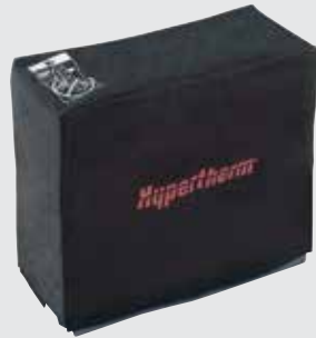
Capa para proteção do sistema contra poeira