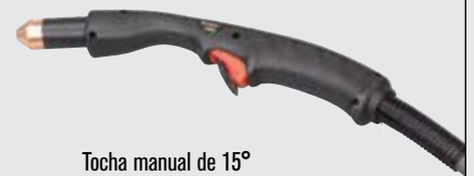
Tocha manual de 15°