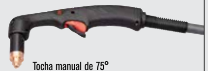
Tocha manual de 75°

(para mais opções de tochas, visite www.hypertherm.com )