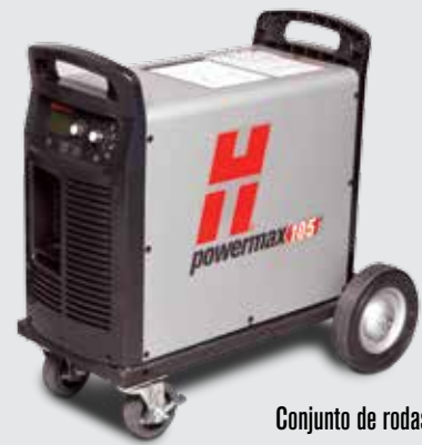
Conjunto de rodas