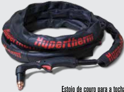
Estojo de couro para a tocha